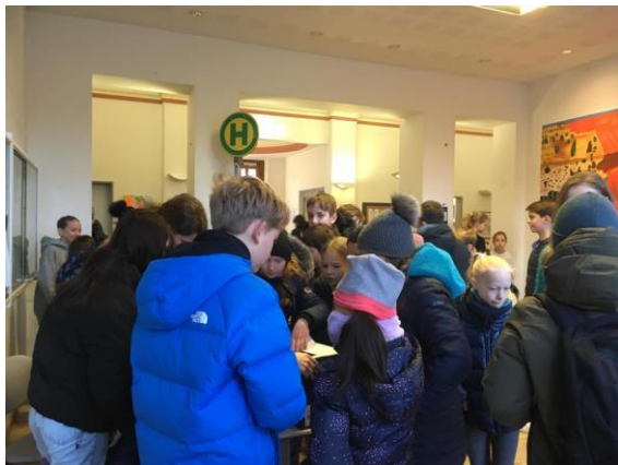
Zahlreiche Bäume können nun dank der Tombola der Klasse 7A im LFS-Wald gepflanzt werden.