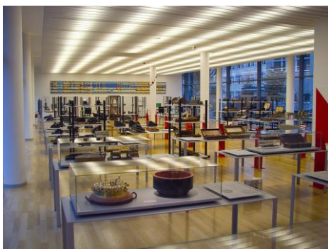
Von Better Than Bacon - Arithmeum, main floor, Bonn, CC BY 2.0, https://commons.wikimedia.org/w/index.php?curid=16049369