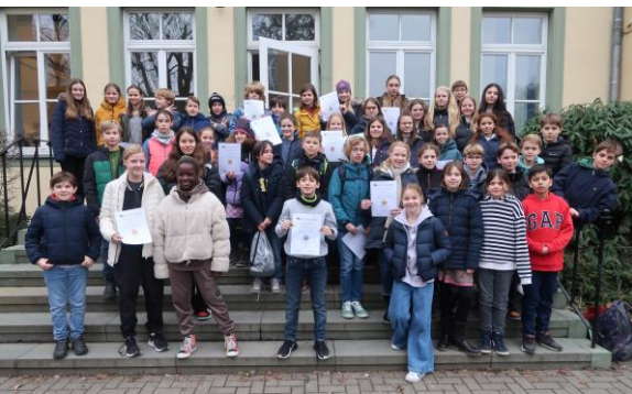
Schülerinnen und Schüler mit einer Gold-, Silber- oder Bronze-Urkunde