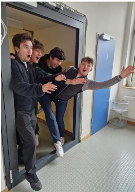
Die Q2 kann durch geschlossene Türen gehen. Zahlreiche Türen wurden versetzt und erneuert.