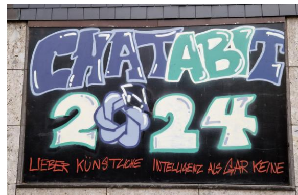
Das Abi-Motto 2024 wurde auf der Wand des E-Baus verewigt.