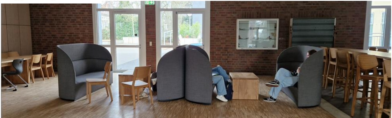
Die neue Sessel im Oberstufen-Aufenthaltsbereich im Forum werden schon gut genutzt.