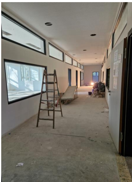
Der neue Kunst- und Musiktrakt im B-Bau nimmt Gestalt an.