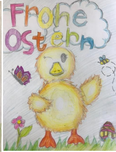
Osterkarten der Klassen 5B und 5D