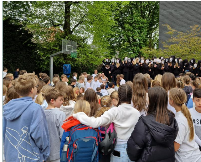
Die Mottowoche der Jahrgangsstufe Q2 stellte den Alltag an der Schule zur Freude aller Schülerinnen und Schüler auf den Kopf.