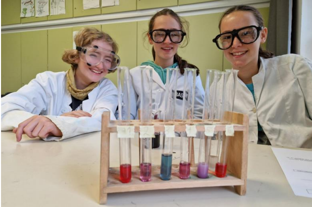
Bioindikatoren erforschen NW 7