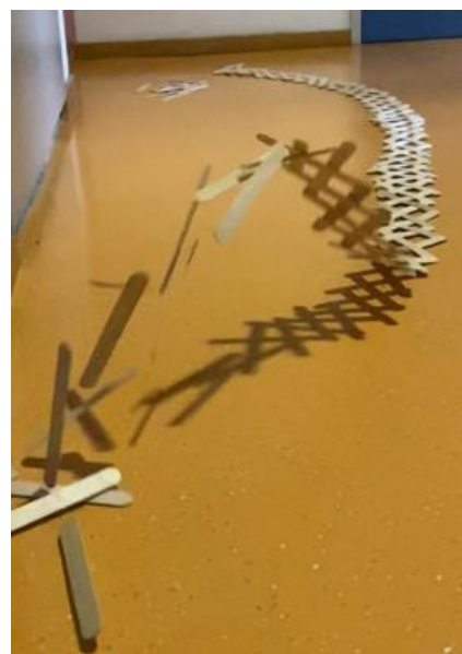
Stickbombs NW 6