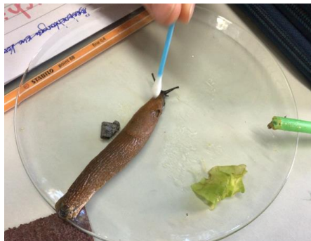
Schnecken beobachten Bio 7