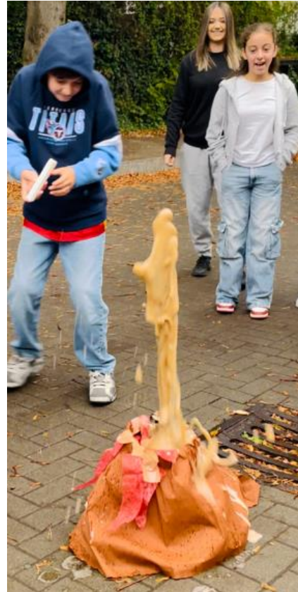
Der Vulkan bricht aus EK 7