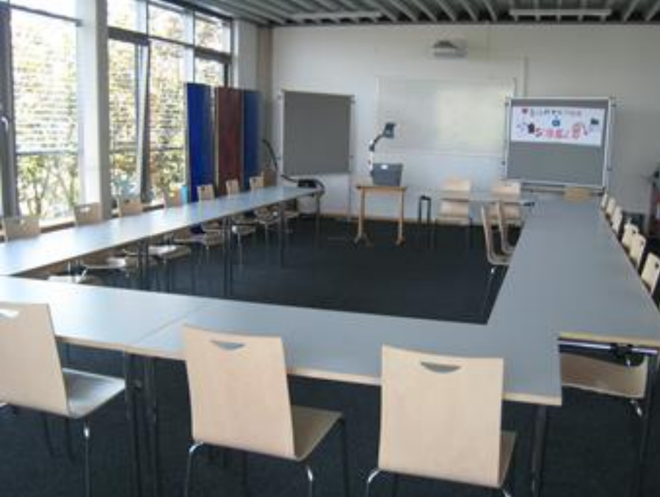
ausreichend Platz für Plenumsveranstaltungen